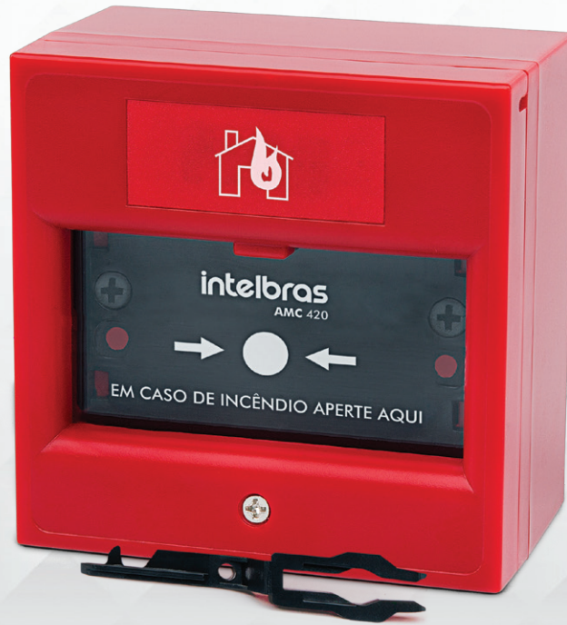
Acionador manual convencional