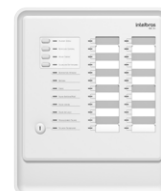
Central de incêndio convencional